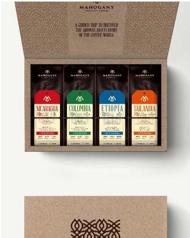
Pack Volta al Món, disponible a la botiga en línia