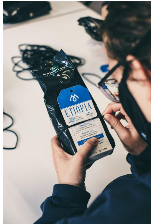
Fundació Els Jons