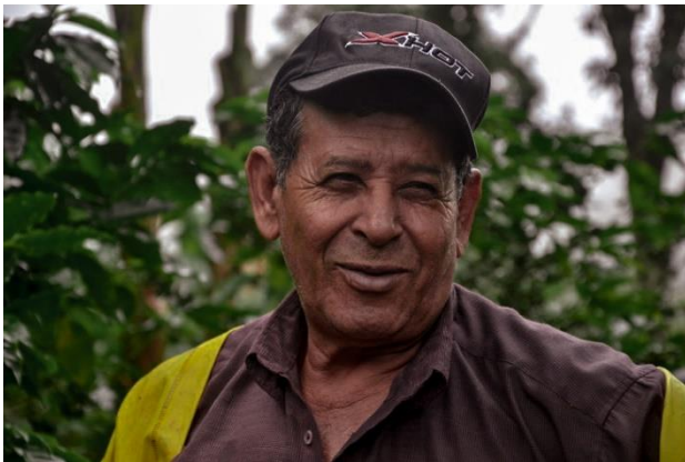
Propietari de la Finca Lasso Argote, Colombia